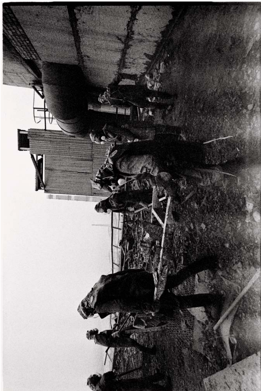
Katastrophenhelfer schaufeln hochradioaktive Trümmer vom Dach des benachbarten Blocks in den Unglücksreaktor. Die Streifen am unteren Bildrand sind von der Strahlung verursacht.